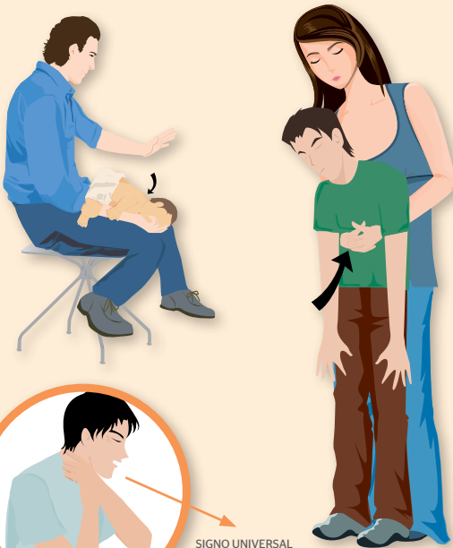
SIGNO UNIVERSAL PARA LA ASFIXIA